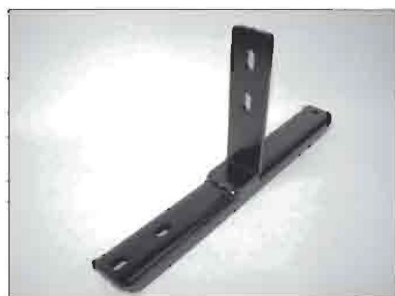
Средний кронштейн 2 шт