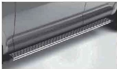
Подножки: правая, левая