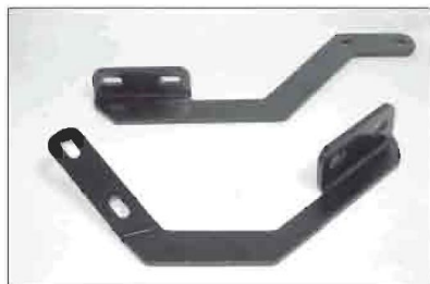
Кронштейны с водительской стороны: передний (сверху), задний (снизу)