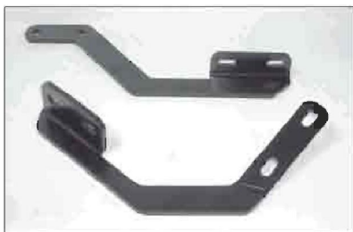
Кронштейны с пассажирской стороны: передний (сверху), задний (снизу)